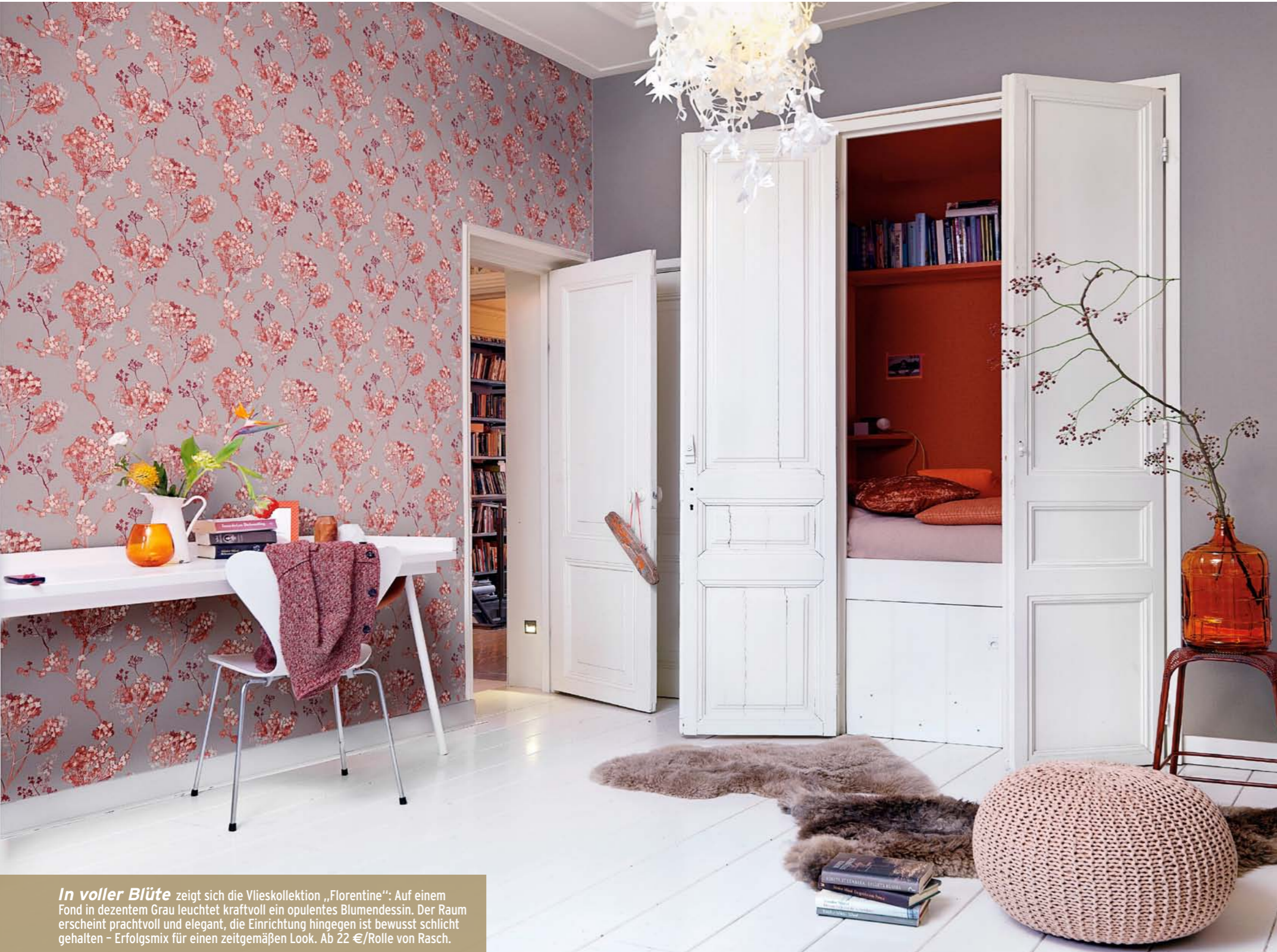
In voller Blüte zeigt sich die Vlieskollektion „Florentine“: Auf einem Fond in dezemtem Grau leuchtet kraftvoll ein opulentes Blumendessin. Der Raum erscheint prachtvoll und elegant, die Einrichtung hingegen ist bewusst schlicht gehalten - Erfolgsmix für einen zeitgemäßen Look. Ab 22 €/Rolle von Rasch.

Räume völlig neu in Szene setzen: Das gelingt per Tapetenwechsel. Dekorative Muster können Romantik schaffen, Glamour verleihen - und sogar die optischen Proportionen vorteilhaft verändern.