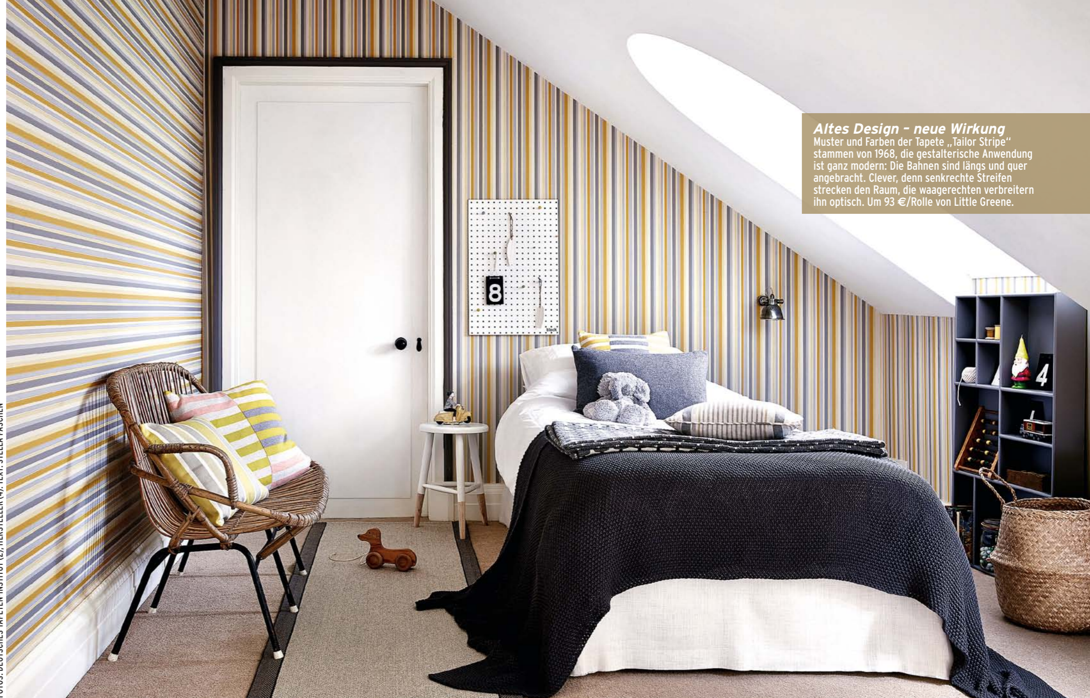
Altes Design - neue Wirkung Muster und Farben der Tapete „Tailor Stripe“ stammen von 1968, die gestalterische Anwendung ist ganz modern: Die Bahnen sind längs und quer angebracht. Clever, denn senkrechte Streifen strecken den Raum, die waagerechten verbreitern ihn optisch. Um 93 €/Rolle von Little Greene.