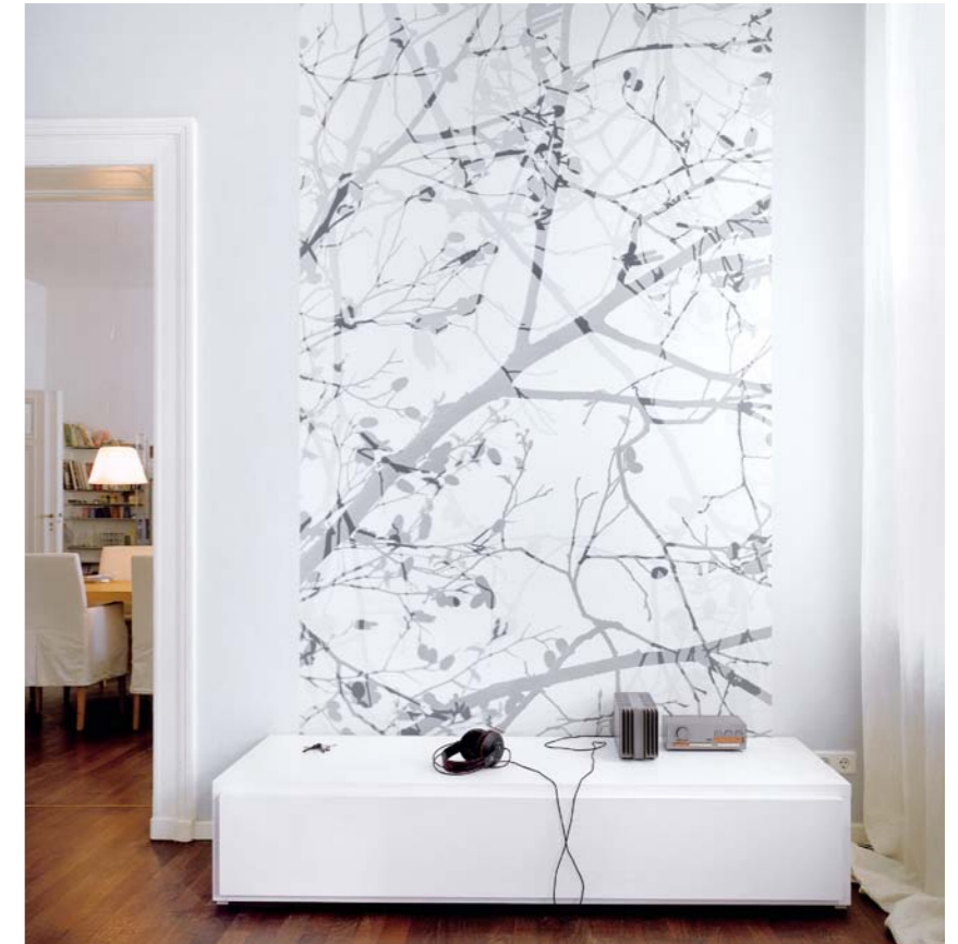
Schattenspiel Zart fügt sich die Fototapete „Kimiko“ in den Wohnraum ein, der Blick gleitet scheinbar durch ein verschleiertes Fenster nach draußen. Das Vlies hat aber noch mehr Qualitäten: Es ist abwaschbar. Drei Bahnen, 139 cm x 280 cm, 146 € von Extratapete.