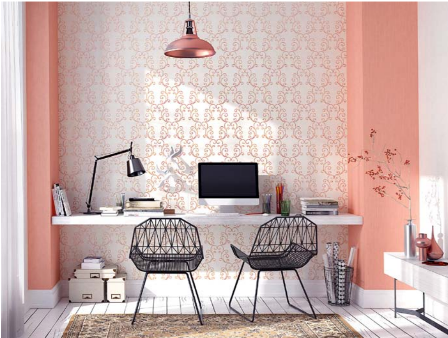
Geniale Fassung Ein guter Trick, um Tapeten mit Ornament-Struktur spannungsreich hervorzuheben: Die Farbe der Musterung für die angrenzenden Wände aufnehmen – oft reicht dazu schon eine Art Rahmen aus. Tapeten-Kollektion „Ophelia“. Ab 18 €/Rolle von Erismann.